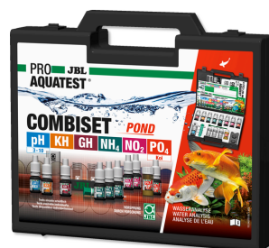
JBL PROAQUATEST COMBISET POND Testkoffer für Wasseranalysen im Koi- und Gartenteich