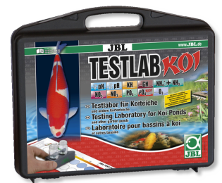
JBL Testlab Koi Maletín de tests profes. p. estanques de kois/jardín