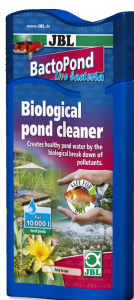
JBL BactoPond Bacterias para la autolimpieza del estanque