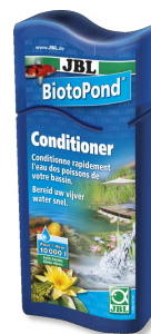
JBL BiotoPond Acondicionador para el agua del estanque