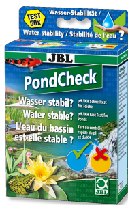
JBL PondCheck Test rápido para determinar el valor del pH y de la KH