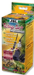
JBL TempSet angle+ connect Kit de instalación para lámparas de terrario