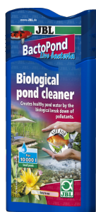
JBL BactoPond Bacterias para la autolimpieza del estanque