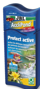
JBL AccliPond Acondicionador para el agua del estanque