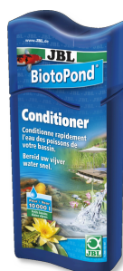
JBL BiotoPond Acondicionador para el agua del estanque