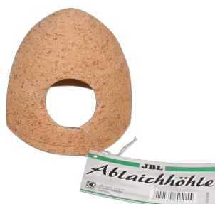
JBL cueva desove de cerámica Cueva de cerámica para acuarios de agua dulce