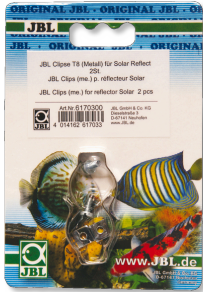
JBL Clips T5/T8 metal Soporte de metal para tubos fluorescentes