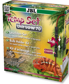
JBL TempSet Unit L-U-W Kit instalación lámparas de vapor metálico (LUW/HQI)