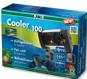
JBL Cooler 100 Refroidisseur pour aquariums eau douce et eau de mer