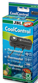
JBL CoolControl Thermostat de commande pour refroidisseurs