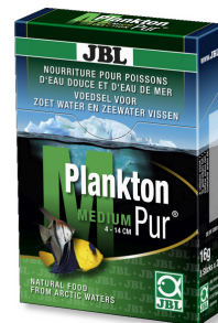
JBL PlanktonPur MEDIUM Friandises pour grands poissons d'aquarium