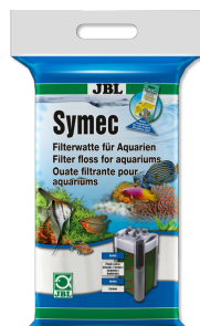
JBL Symec Ouate filtrante Ouate filtrante contre toute turbidité de l'eau