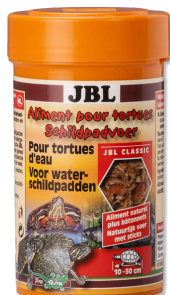
JBL Mangime per tartarughe Mangime principale per tartarughe d'acqua