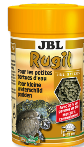
JBL Rugil Bastoncini alimentari per piccole tartarughe d'acqua