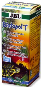
JBL Biotopol T Biocondizionatore per terrari