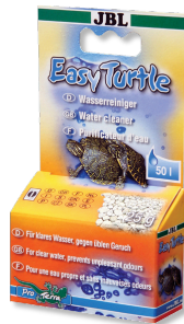
JBL Easy Turtle Granulato speciale per eliminare gli odori