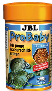
JBL ProBaby Mangime speciale per tartarughe acquatiche giovani