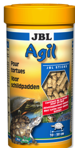
JBL Agil Bastoncini per tartarughe d'acqua 10 - 50 cm