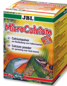
JBL MicroCalcium Mangime complementare con minerali per tutti i rettili