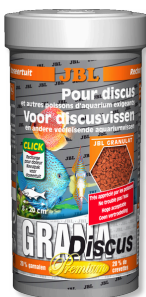
JBL GranaDiscus Mangime di base Premium in granuli per pesci discus