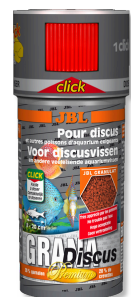
JBL GranaDiscus CLICK Mangime completo Premium in granuli per pesci disco