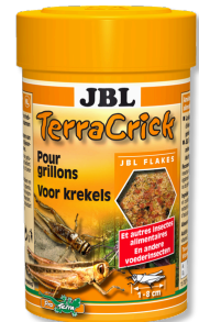
JBL TerraCrick Mangime completo per insetti da pasto