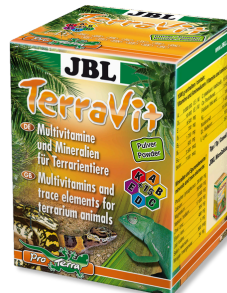
JBL TerraVit Vitamine ed elementi traccia per animali da terrario