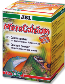
JBL MicroCalcium Mangime complementare con minerali per tutti i rettili