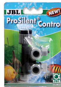
JBL ProSilent Control Rubinetto di chiusura aria regolabile