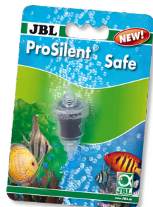
JBL ProSilent Safe Valvola di non ritorno