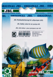
JBL Valvola di non ritorno Valvola di non ritorno per pompe ad aria