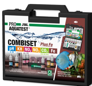
JBL PROAQUATEST COMBISET Plus Fe Valigetta con i più importanti test acqua + test ferro