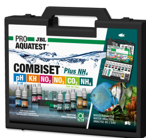
JBL PROAQUATEST COMBISET Plus NH4 Valigetta con i più importanti test acqua + test NH4