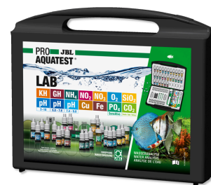
JBL PROAQUATEST LAB Valigetta con 13 test per l'analisi dell'acqua dolce