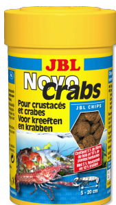
JBL NovoCrabs Voederchips voor kreeften