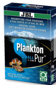
JBL PlanktonPur SMALL Lekkernijen voor kleine aquariumvissen