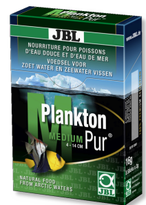
JBL PlanktonPur MEDIUM Lekkernij voor grote aquariumvissen