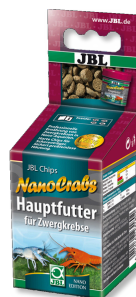
JBL NanoCrabs Hoofdvoer voor dwergkreeften