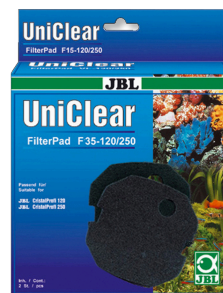
JBL FilterPad F35 Fijn schuimstof voor CristalProfi aquariumfilters