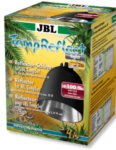
JBL TempReflect light Reflecterend scherm voor energiespaarlampen