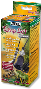
JBL TempSet connect Installatieset met steekverbinding