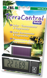
JBL TerraControl Solar. Solar thermo- en hygrometer voor alle soorten terraria