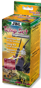
JBL TempSet angle+ connect Installatieset voor straallampen in terraria