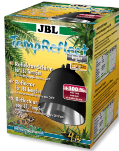
JBL TempReflect light Reflecterend scherm voor energiespaarlampen