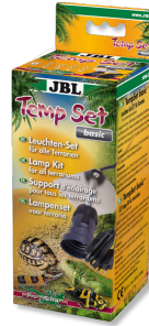
JBL TempSet basic Installatieset voor straallampen in terraria