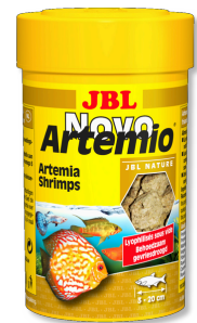
JBL NovoArtemio Aanvullend artemiavoer voor alle aquariumvissen