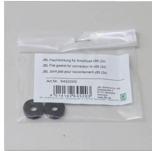
JBL ProFlora u95 platte dichting