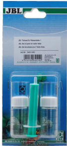
JBL onderdelenset voor watertesten