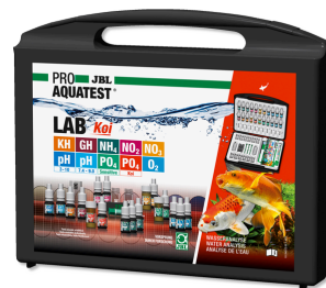
JBL PROAQUATEST LAB koi Professionele testkoffer voor koi- en tuinvijvers