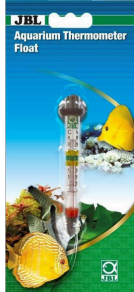
JBL Termometr do akwarium Float Termometr do akwarium