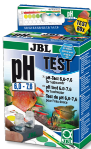
JBL pH 6,0-7,6 Test pH-Test do akwariów słodkowodnych w zakresie 6,0-7,6