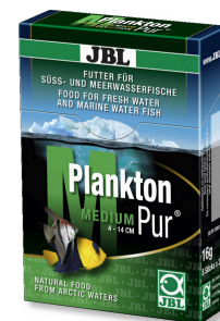
JBL Plankton Pur MEDIUM Smałyk dla dużych ryb akwariowych