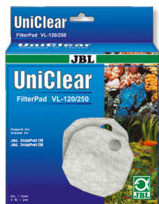
JBL FilterPad VL Wata filtracyjna do filtrów akwariowych CristalProfi