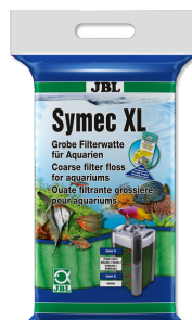
JBL Symec XL Wata filtracyjna o małej gęstości przeciwko wszystkim zmętnieniom wody