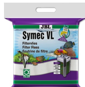
JBL Symec VL Włóknina filtracyjna do filtrów akwariowych przeciwko wszystkim zmętnieniom wody