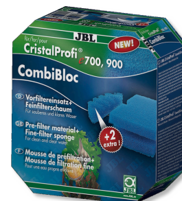
JBL CombiBloc CristalProfi e Wkłady do przedfiltra i Gąbka do CristalProfi e