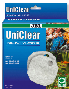
JBL FilterPad VL Wata filtracyjna do filtrów akwariowych CristalProfi