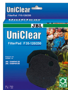
JBL FilterPad F35 Drobnoporowata pianka do filtrów akwariowych CristalProfi