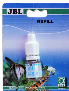
JBL pH 7,4-9,0 Test pH-Test do akwariów & stawów ogrodnich w zakresie 7,4-9,0