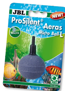
JBL ProSilent Aeras Micro Ball L Kamień napowietrzający do drobnych pęcherzyków powietrza

Pływak mit ochroną przeciwzgięciową do węży do zestawu PondOxi-Set