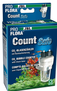
JBL PROFLORA CO2 Count Safe Licznik bąbelków z zaworem zwrrotnym