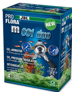
JBL PROFLORA m001 duo Armatura do reduktora ciśnienia do 2 dyfuzorów CO2