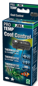
JBL PROTEMP CoolControl

Termostat do sterowania chłodzącymi dmuchawami