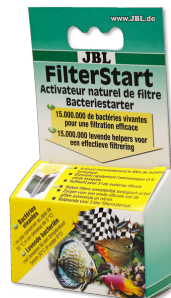
JBL FilterStart Bactérias para a ativação de filtros