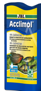
JBL Acclimol Condicionador de água para nova aclimação