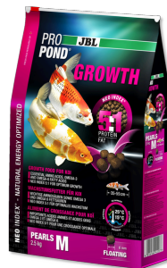
JBL ProPond Growth M Корм для роста карпов кои среднего размера