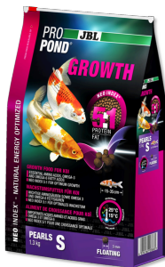
JBL ProPond Growth S Корм для роста небольших карпов кои