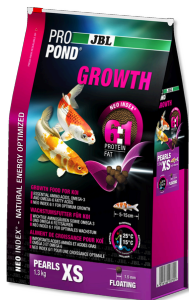
JBL ProPond Growth XS Корм для роста очень маленьких кои