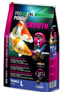
JBL ProPond Growth L Корм для роста кои большого размера