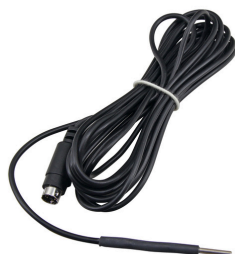
JBL pH Control Touch датчик температуры

Резиновая присоска с зажимом для предметов диаметром 12 мм