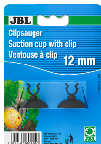
JBL suction cup with clip, 12 mm

Резиновая присоска с зажимом для предметов диаметром 12 мм