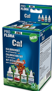
JBL PROFLORA Cal Комплект для калибровки