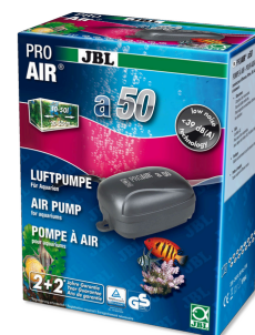
JBL PROAIR a50 Компрессор для аквариума