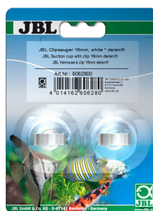
JBL suction cup with clip, 16 mm Резиновые присоски для объектов диаметром 16 мм