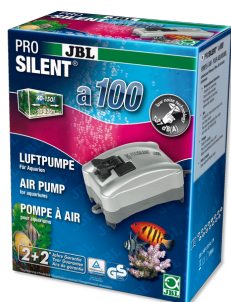
JBL PROSILENT a100 Компрессор для пресноводных и морских аквариумов