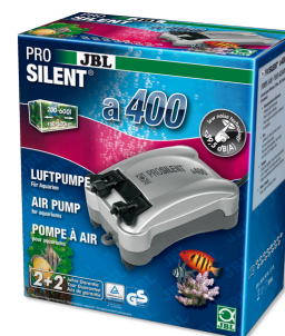
JBL PROSILENT a400 Компрессор для пресноводных и морских аквариумов