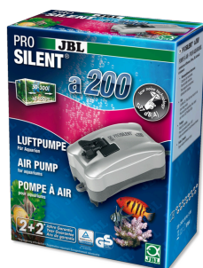
JBL PROSILENT a200 Компрессор для пресноводных и морских аквариумов