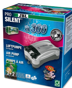
JBL PROSILENT a300 Компрессор для пресноводных и морских аквариумов