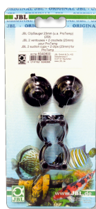
JBL suction cup with clip 23 mm Резиновые присоски для предметов диаметром 23-28 мм