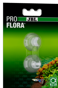
JBL suction cup with clip, 6 mm Прозрачные присоски с клипсой для объектов Ø ≈ 6 мм