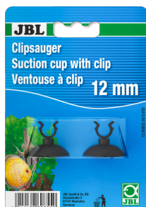
JBL suction cup with clip, 12 mm Резиновая присоска с зажимом для предметов диаметром 12 мм