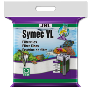
JBL Symec VL Her türlü su bulanıkl. karşı akv. filt.-pamuğu keçesi