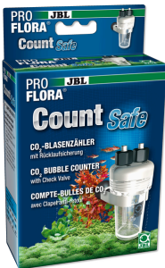
JBL PROFLORA CO2 Count Safe Çek valfli kabarcık sayacı