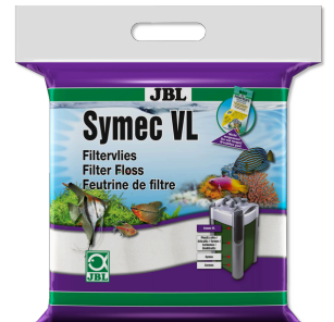
JBL Symec VL Her türlü su bulanıkl. karşı akv. filt.-pamuğu keçesi