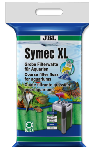
JBL Symec XL Filtre yünü Her türlü su bulanıklığına karşı kaba akv. filt. pam.