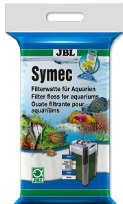
JBL Symec Tüm su bulanıklıklarına karşı filtre pamuğu