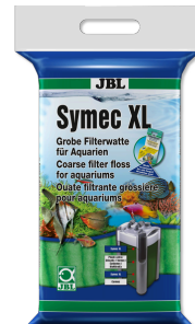
JBL Symec XL Filtre yünü Her türlü su bulanıklığına karşı kaba akv. filt. pam.