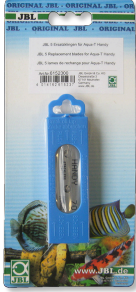
JBL Aqua-T Handy yedek bıçak, x5 Aqua-T Handy için yedek bıçaklar