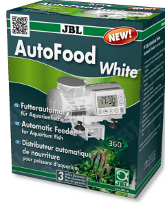
JBL AutoFood WHITE Akvaryum balıkları için beyaz yem otomatı