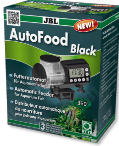
JBL AutoFood BLACK Akvaryum balıkları için siyah yem otomati