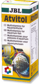
JBL Atvitol Akvaryum balıkları için multi vitamin damlaları