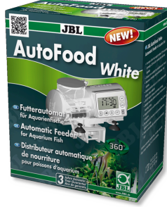
JBL AutoFood WHITE Akvaryum balıkları için beyaz yem otomati