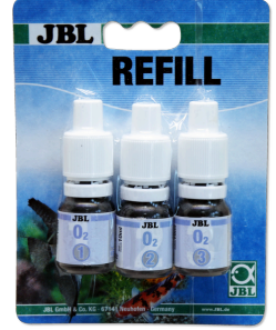
JBL O 2 oksijen testi New Formula (yeni formül)

Oksijen içeriğini saptamaya yönelik hızlı test