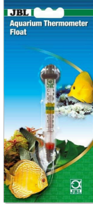
JBL Akvaryum termometresi, yüzen Akvaryum termometresi