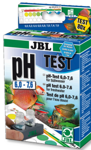
JBL pH 6,0-7,6 testi Tatlı su akvaryumları için 6,0-7,6 aralığında pH testi