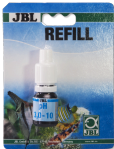
JBL pH 3,0-10,0 testi Asiditeyi saptamaya yönelik hızlı test