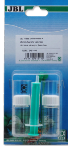
Su testleri için JBL parça seti