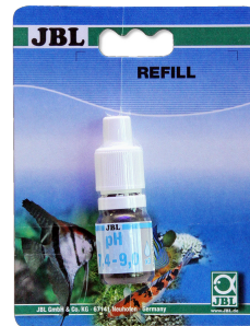
JBL pH 7,4-9,0 testi T. su akv. ve havuzl. için 7,4-9,0 aralığında pH testi