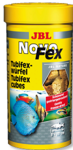
JBL NovoFex Tubifeks küpleri, akv. bal. için lezzetli atıştırma.