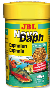
JBL NovoDaph Su pireleri, akv. balıkları için lezzetli atıştırma