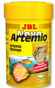
JBL NovoArtemio Tüm akvaryum balıkları için tamamlayıcı artemia yem