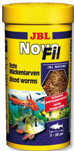
JBL NovoFil Seçici akv. bal. için kırmızı sivrisinek larvaları