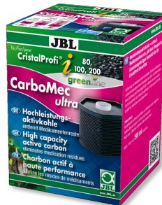
JBL CarboMec ultra Pad CristalProfi i60/80/100/200

CristalProfi i için yüksek perf. filtre biyeleri