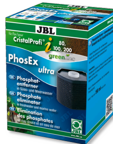
JBL PhosEx Ultra CristalProfi i60/80/100/200

CP i ürün grubu için aktif karbonlu filtre kartuşu