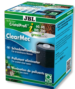
JBL ClearMec CristalProfi i60/80/100/200

JBL CristalProfi i için fosfat gideren filtre kartuşu