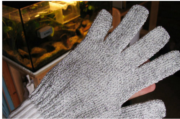
Der Handschuh im "frischen" Zustand

Das Becken sauber zu kriegen war eine Sache von wenigen Minuten. Wenn ich die Steine alle hätte raus nehmen und schrubben wollen, hätte