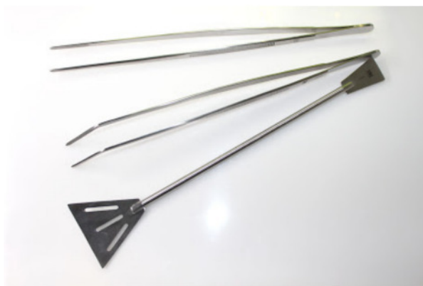
Die JBL AquaTerra Tools: Eine gerade Pinzette, eine Pinzette mit gebogener Spitze und ein Sand-Flattener