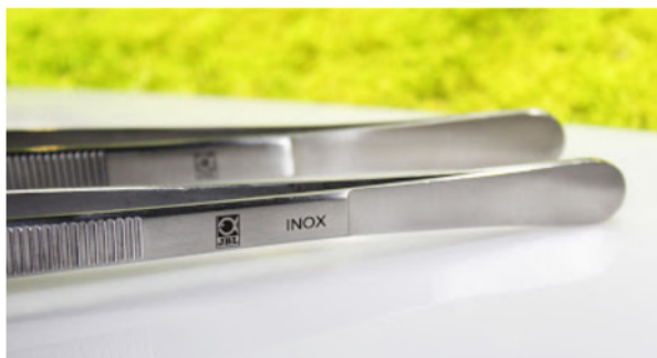
Die Tools sind aus rostfreiem INOX-Edelstahl und somit für Süß- und Meerwasser einsetzbar!