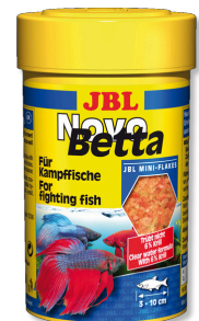
JBL NovoBeta Alleinfutter für Labyrinthfische z. B. Kampffische