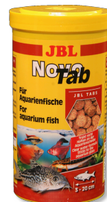
JBL NovoTab Hauptfuttertablette für alle Aquarienfische