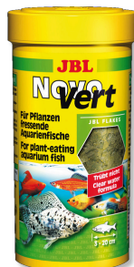
JBL NovoVert Hauptfutterflocken für pflanzenfressende Fische