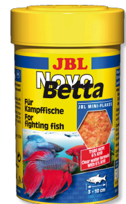
JBL NovoBetta Mangime completo per pesci labirinto come i pesci combattenti