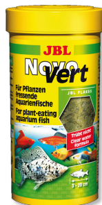
JBL NovoVert Mangime di base: fiocchi per pesci d'acquario erbivori