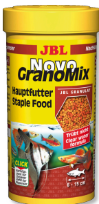
JBL NovoGranoMix Mangime di base per pesci d'acquario medi e grandi