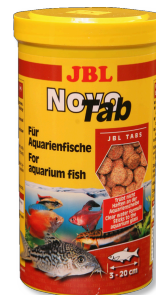
JBL NovoTab Mangime base in compresse per tutti i pesci d'acquario